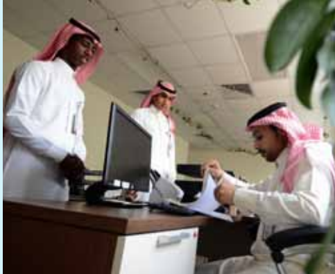
صقر في أثناء تأدية مهام عمله

إنما القصد من الوجود، الطموح إلى ما وراء الوجود.