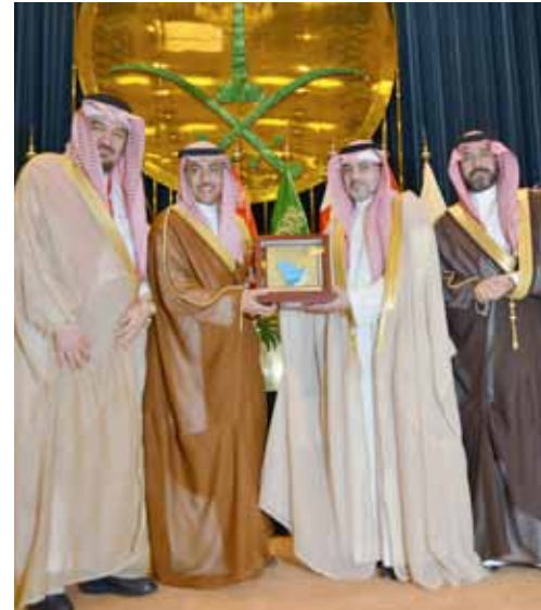
د. اليماني يسلم نائب وزير الصحة درعاً تذكاريًا

ونظمت مدينة الملك فهد الطبية المؤتمر الخليجي الأول لحقوق المريض بالتعاون مع كل من المكتب التنفيذي لمجلس وزراء الصحة لدول مجلس التعاون لدول الخليج العربية، ووزارة الصحة السعودية، وهيئة حقوق الإنسان، والمجلس الصحي السعودي، والمنظمة الإسلامية للعلوم الطبية، ومجلس الضمان الصحي التعاوني، والهيئة السعودية للتخصصات الصحية، في قاعة الملك فيصل للمؤتمرات في الرياض، وافتتحة نيابة عن وزير الصحة نائب وزير الصحة حمد بن محمد الضويلع.