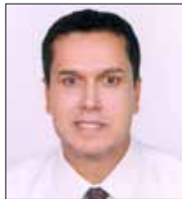
Dr. Abdullah bin Ahnha

It is high time for all Arab countries to realize that the best and most successful investment is not only the investment made in universities and higher institutes, but it is rather investing in the Arab public school. The countries that invested in their elementary, intermediate and secondary