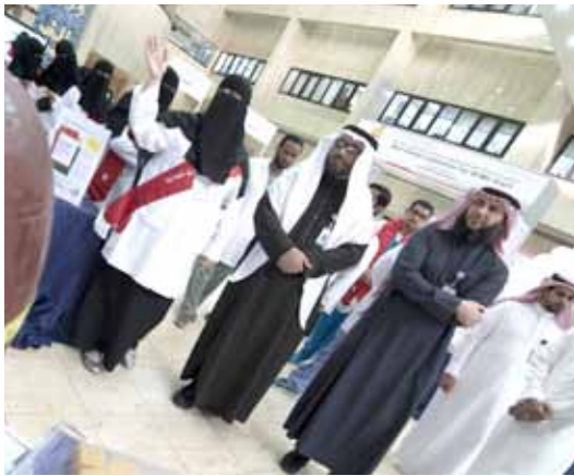
Launching the Mobile Nutritional Clinic