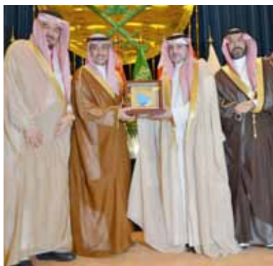
Dr. Al-Yamany presents a token of appreciation to the Deputy Minister of Health

During the conference, the Minister of Health, Eng. Khalid bin Abdul-Aziz Al-Faleh requested that a high-level committee be formed.