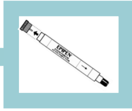
نزع صمام الأمان