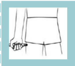
الحقن في عضلة الفخذ ولمدة عشر ثوان